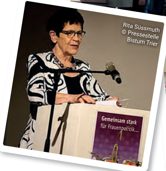
Rita Süsmuth