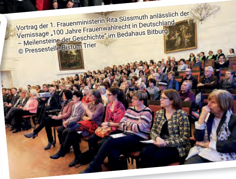
Vortrag der 1. Frauenministerin Rita Süsmuth anlässlich der Vernissage „100 Jahre Frauenwahlrecht in Deutschland – Meilensteine der Geschichte“ im BedaHaus Bitburg