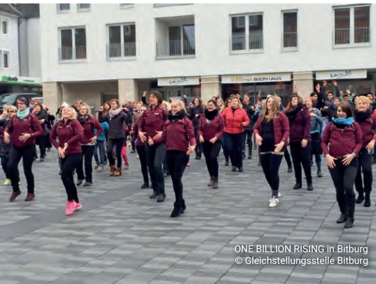
ONE BILLION RISING in Bitburg

Immer wenn Frauen sich gesellschaftlich übergreifend solidarisierten und ihre Forderungen öffentlich vortrugen, hatten sie Chancen auf Erfolg. So entstanden im Laufe der Zeit unterschiedliche Aktionstage, deren Ziel es nach wie vor ist, auf bestehende Mängel hinzuweisen und Veränderungen einzufordern.