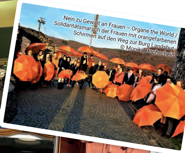
Nein zu Gewalt an Frauen – Organe the World / Solidaritätsmarsch der Frauen mit orangefarbenen Schirmen auf den Weg zur Burg Landshut.