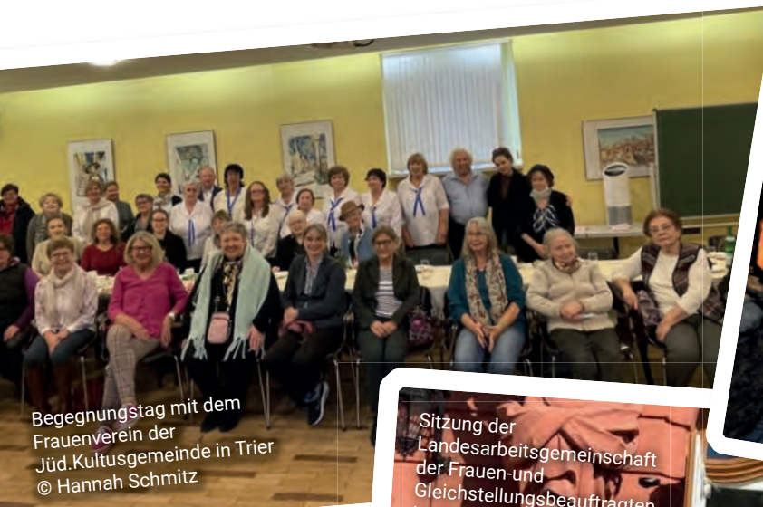
Begegnungstag mit dem Frauenverein der Jüd.Kultusgemeinde in Trier