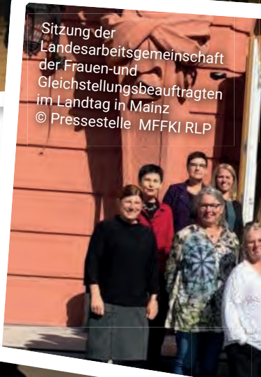
Sitzung der Landesarbeitsgemeinschaft der Frauen-und Gleichstellungsbeauftragten im Landtag in Mainz