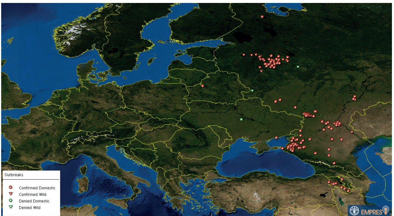
Abb. 1: Ausbrüche der ASP in der Russischen Föderation und einigen Trans-Kaukasischen Ländern Mitte 2011 bis Mitte 2013.

Außerhalb Afrikas trat das Virus von den 1960er bis zum Ende der 1990er Jahre auf der Iberischen Halbinsel auf. Kurze Episoden betrafen in Europa auch die Niederlande, Frankreich, Malta und Belgien sowie auf dem amerikanischen Kontinent Brasilien, Haiti, die Dominikanische Republik und Kuba. Der Eintrag des Virus nach Sardinien im Jahre 1978 hat zu einer bis heute andauernden Endemie geführt, die in den letzten Monaten mit multiplen Ausbrüchen in Haus- und Wildschweinen verbunden war.