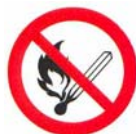
(Bildzeichen P02 nach BGV A8)

Feuer, Rauchen und offenes Licht verboten